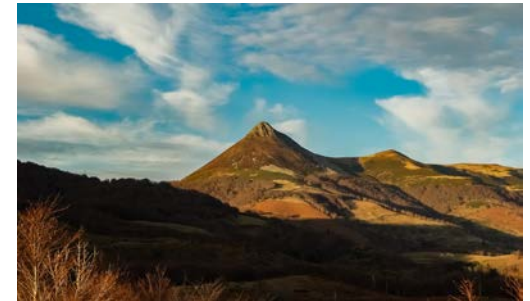
Auvergne (Cantal) Frankreich