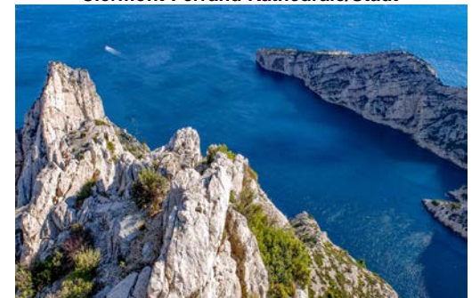
Der Nationalpark Calanques Marseille/Mittelmeer