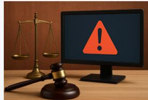
KI-Suchergebnisse – keine haftungsfrei Zone 18. März 2026 Nachrichten der Woche