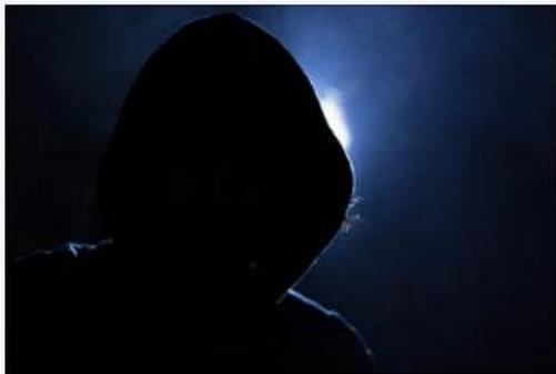
Firehound AI Data Leak 19. März 2026 Nachrichten der Woche