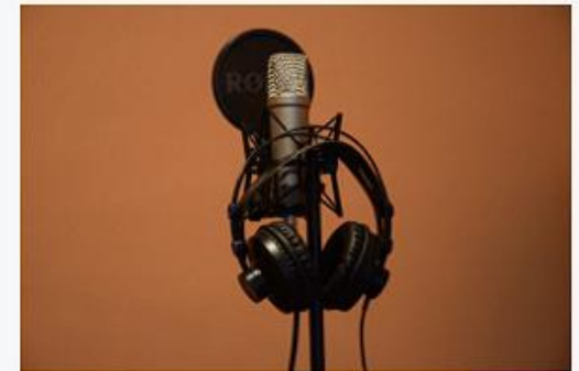
Music Detection – Deezer 18. März 2026 Nachrichten der Woche