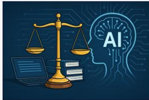
Rechtliche Regularien für KI – Europäisches Gremium für KI 19. März 2026 Nachrichten der Woche