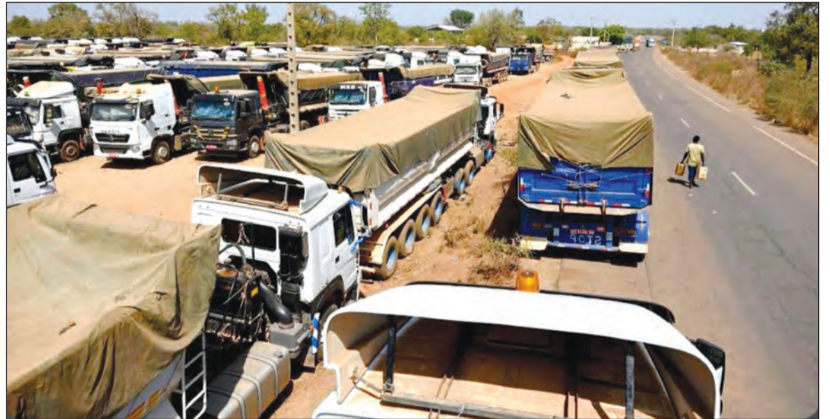
La grève dans les transports routiers n'est toujours pas levée