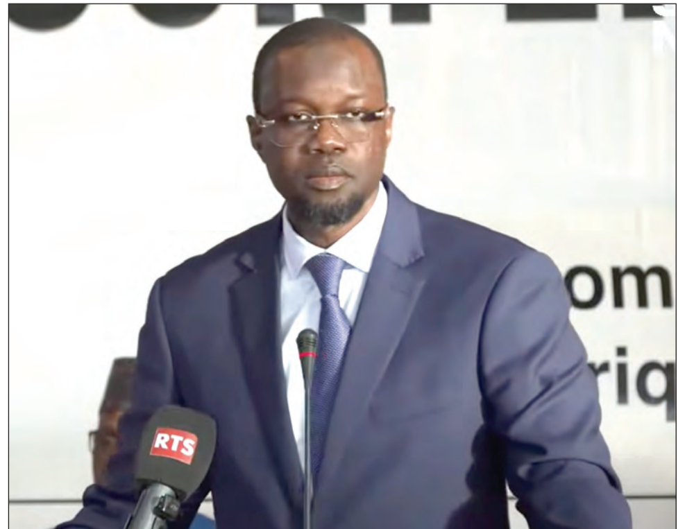
Le Premier ministre Ousmane Sonko a dégainé contre Trump qu'il accuse de déstabiliser le monde

L'Iran et les Usa ont entamé leurs premières négociations au Pakistan depuis le début de la guerre lancée par Washington contre Téhéran, le 28 février dernier. Les deux belligérants disent observer un cessez-le-feu en attendant de discuter un plan de paix en dix points. Sonko estime que les Usa, n'ayant atteint aucun de leurs objectifs en Iran, à savoir faire tomber le régime des mollahs, réduire les capacités balistiques de Téhéran, imposer à l'Iran de renoncer à tout programme nucléaire civil ou militaire, ont été «obligés de discuter et de négocier avec ce même régime».