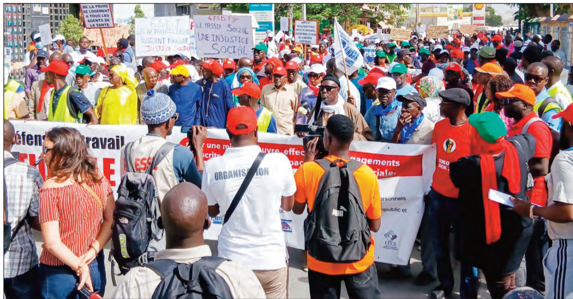
Le Front syndical pour la défense du travail (FsdT) a organisé une marche nationale, avant-hier

Le front social est en ébullition avec un conflit ouvert entre le pouvoir et les organisations syndicales. La crise s'est installée pratiquement dans tous les secteurs d'activités: éducation, santé, transports... créant du coup, un blocage à tous les niveaux.