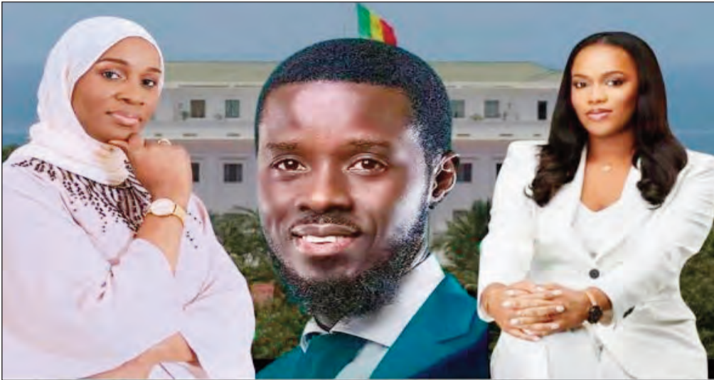
Avec leur Fondation, les deux épouses du Président Diomaye semblent perpétuer une tradition

La Fondation des deux Premières dames, lancée en grande pompe avant-hier, ne fait pas l'unanimité. Dans un communiqué, l'organisation de la société civile Action pour les droits humains et l'amitié (Adha) s'interroge sur la nécessité et la pertinence de la création de la Fondation des deux épouses du Président Diomaye. Ces acteurs de la société civile posent ainsi un certain nombre d'interrogations. « Quelle est sa justification dans un contexte de restriction budgétaire ? Et d'où proviendront ses financements ? », se demandent-ils.