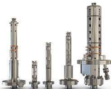
Hiden Analytical Europe GmbH