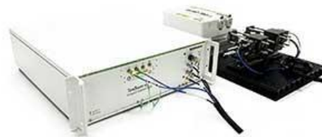
Menlo Systems GmbH