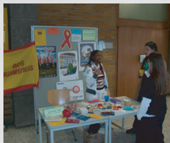
Stand auf dem Infobasar der Universität 2004