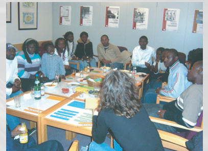
Arbeitskreis AIDS Workshop 2006