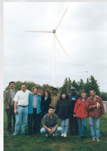
Seminar zu Wasser und Windenergie 1997