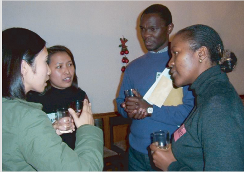
StudienkollegiatInnen im Gespräch mit StipendiatInnen des Kirchlichen Entwicklungsdienstes (KED)