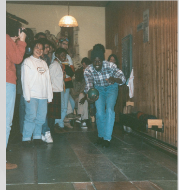
Kennenlernen deutscher Kultur