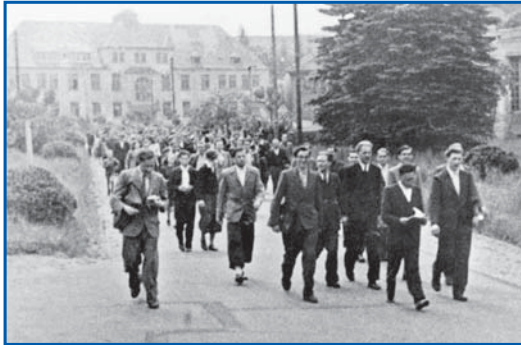
Der legendäre Streik der Studierenden des Homburger Hochschulinstituts: Protestmarsch am 14. Mai 1948 und Übergabe der Resolution.