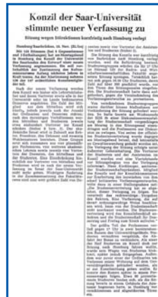
20 Jahre später: Im Herbst 1968 protestieren die Studierenden auch an der Universität des Saarlandes für eine Hochschulreform. Wegen massiver Proteste auf dem Saarbrücker Campus beschließt das Konzil die Universitätsverfassung in Homburg.