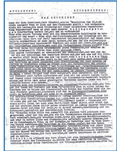
Der Aufruf zum Streik!