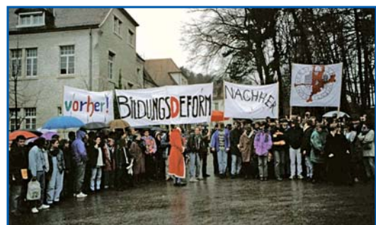
30 Jahre nach dem Umbruchjahr 1968 beteiligen sich im Wintersemester 1997–1998 auch die Studierenden in Homburg an den bundesweiten Streikaktionen für eine bessere finanzielle Ausstattung der Hochschulen.