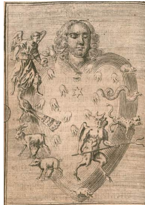
Johann Salver, Geistlicher Seelen-Spiegel, Würzburg 1733

Mit Blick auf die Gegenwart wollen wir erwägen, wie sich die reformatorische Anthropologie heute fassen lässt, in welchen Phänomenen der Gegenwartskultur sich Spuren einer solchen Sicht auf den Menschen entdecken lassen und wie sich nicht zuletzt Rechtfertigung vor dem Hintergrund solcher Phänomene neu verständlich machen ließe.