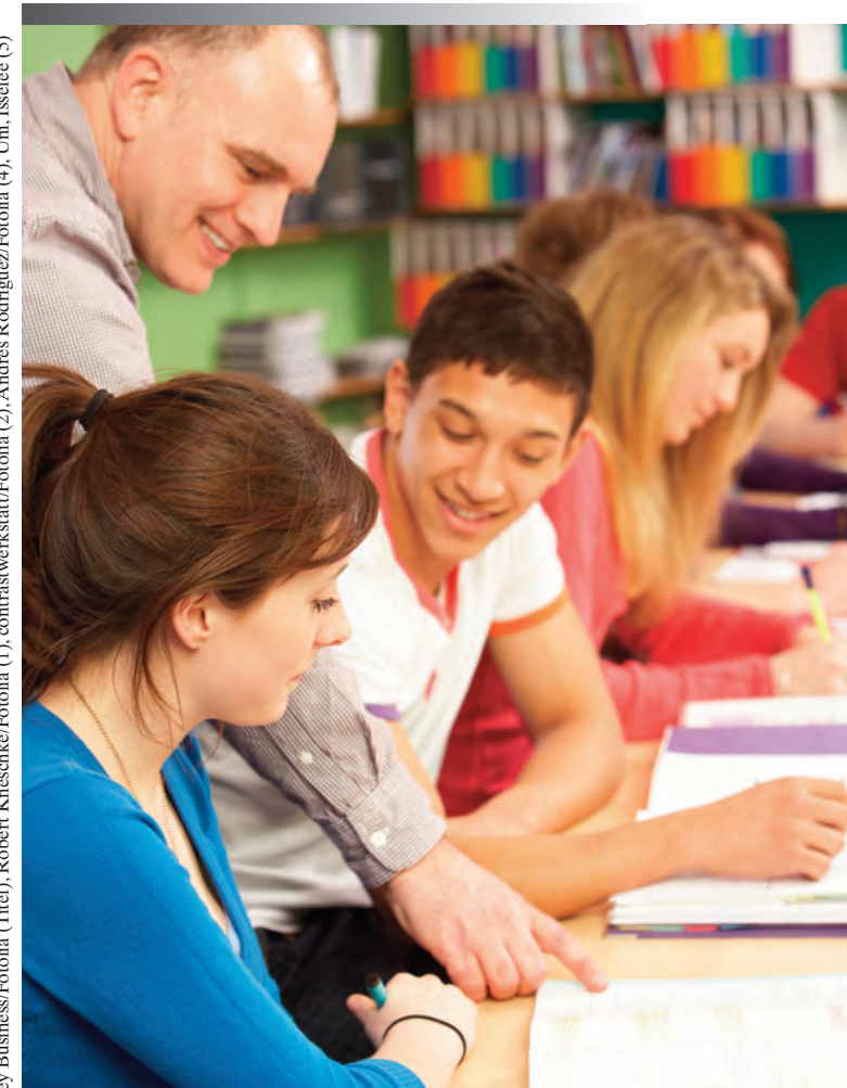
Stand: September 2016