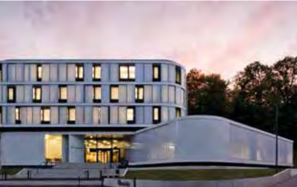
Das Fraunhofer IZFP ist mit der Materialforschung der Saar-Uni vernetzt.

IM Umfeld der Universitat des Saarlandes haben sich in den vergangenen Jahrzehnten alle groen Wissenschaftsorganisationen Deutschlands niedergelassen und haben aueruniversitare Institute gegrundet, die das Saarland als Wissenschaftsstandort charakterisieren. Oft sind Wissenschaftler der Universitat auch fuhrende Forscher in diesen Instituten.