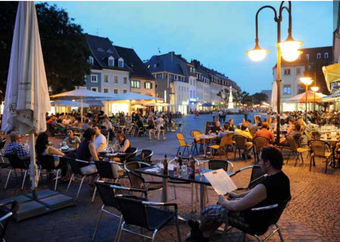
Der St. Johanner Markt mitten in der Fußgängerzone ist der abendliche Treffpunkt in Saarbrücken.

Impressum Image-Broschüre der Universität des Saarlandes, Stand: Juli 2018.